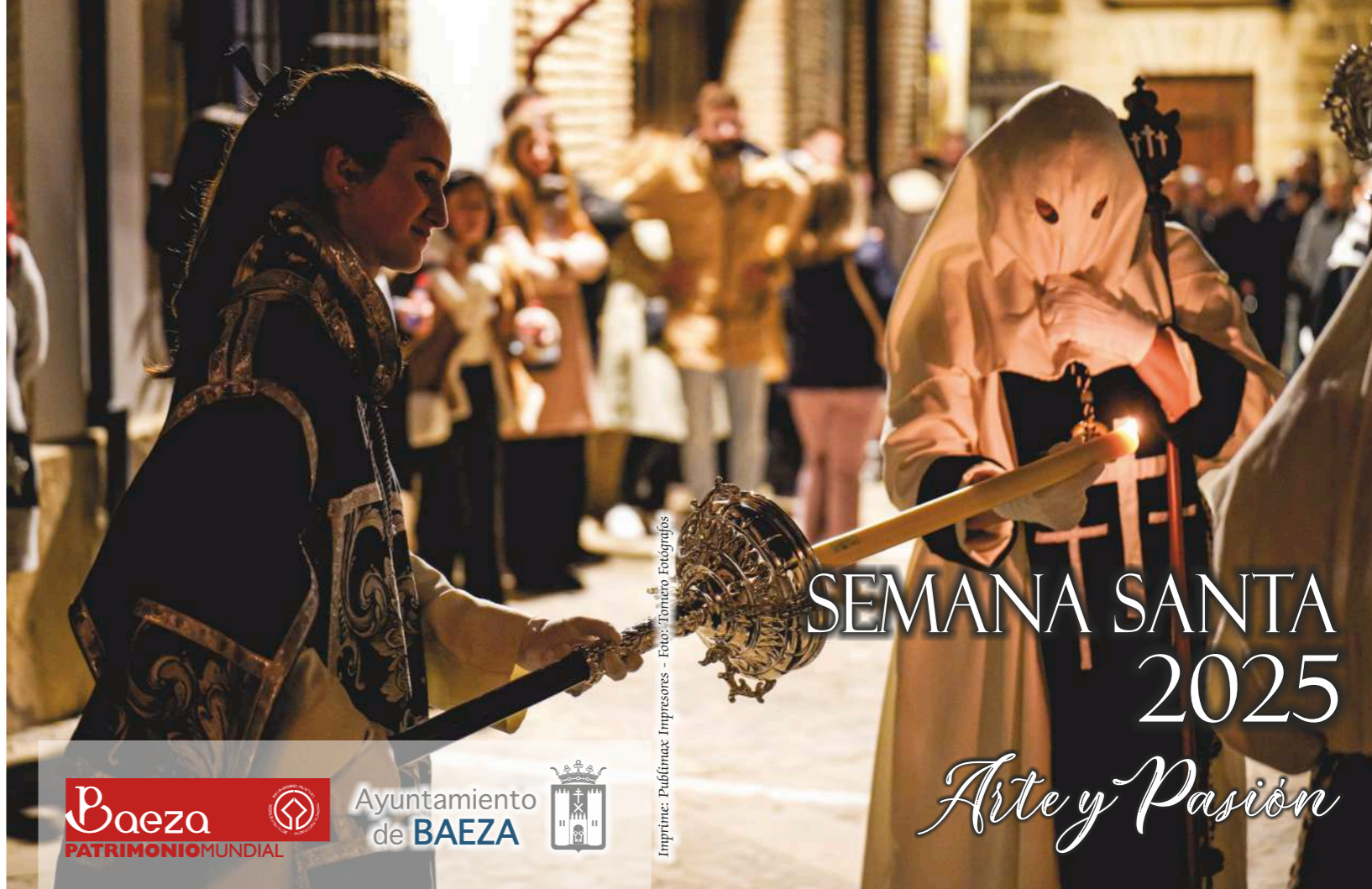
Impresora: Puffinmat Impresores